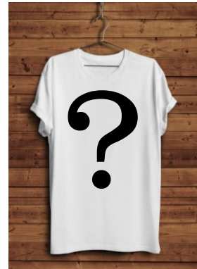
○第10回記念Tシャツ * デザインはシークレットになります