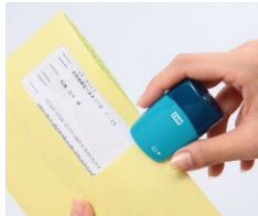
○ローラー式個人情報保護スタンプ 「コロレッタ」