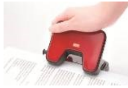
○穴あけパンチ「スクーバ」