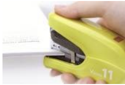
○ホッチキス「Vaimo 11 FLAT」