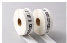
※LP-700SA2のみ使用可 (LP-500Sシリーズでは使用できません)

ラベル用紙の材質変更 (キャスト、ユボなど)、及び特注サイズでの加工を承ります。 ● 用紙種類 / 上質感熱紙、キャスト (コート紙)、ユボサーマル、高耐久感熱紙 ● サイズ / LP-500Sシリーズ: 幅32mm、40mm、52mm / ピッチ12mm~80mm LP-700SA2: 幅25~70mm / ピッチ15mm~180mm ● プレ印刷 / 事前のラベルへのロゴマーク・ロゴ書体の印刷など ※専用ラベル紙となります。詳しくは販売店・最寄りの弊社営業所までお問い合わせください。