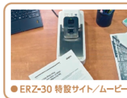
●ERZ-30 特設サイト/ムービー

■外寸/幅126×奥行273×高さ105mm ■重量/2kg ■適合針/No.10、No.11、No.3、No.35、No.20FE、No.70FE、No.110FE、コピー機用フィニッシュ針 ■奥行/紙端から最大27mm ■同梱/本体、ACアダプタ、電源コード、取扱説明書 ■備考/PPC用紙64kg/m 2 対応、端子径が3.5mmの市販のフットスイッチが取付可能(別売)