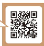
使用シーンが確認できます! 公式Instagram開設!