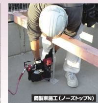
鋼製束施工(ノーストップN)

※本機はボルトがけ付する釘のみ対応とさせていただきます。釘の先端形状や長さによって、釘の打ち込み具合が異なります。釘の先端形状や長さによって、釘の打ち込み具合が異なります。