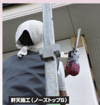
軒天施工(ノーストップS)

釘によっては両方のノーストップで使用できますので、部品交換の頻度を少なくできます。※釘ごとに使用できるノーストップを取説説明書をご確認ください。