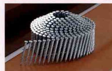
【薄鋼板】 1.6ミリ厚のCチャンネルにV5鋼板釘が打てる。