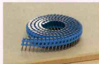
【内装】 25ミリプラシート釘が打てる!

内装ボード用のプラシート釘に加え木下地窯業系サイディング用のV2プラシート釘が打てます。また内・外装用、下地用、フロア用、薄鋼板用のワイヤ連結釘も打てます。使用釘は25ミリ〜50ミリまでの何と136種類!!