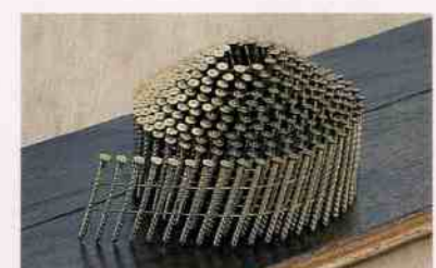
【内装フロア】 高保持力、リバースロックネイルが打てる。