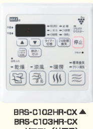
BRS-C102HR-CX ▲ BRS-C103HR-CX ▲ リモコン(付属品)

乾燥モードの運転終了後に、送風と共にプラズマクラスターイオンを放出・循環させます。