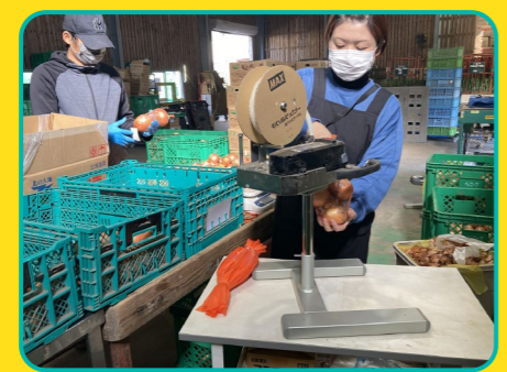
急な梱包作業で、限られたスペースでも