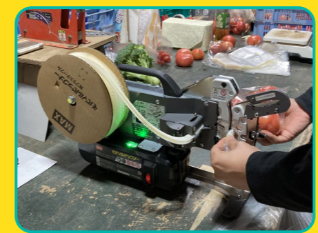
電源コンセントのない梱包作業場など