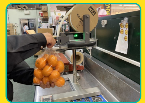
バックヤードの狭い作業テーブルに

シンプルな設計で、だれでも出来る使いやすさにこだわりました。袋をかるくひねりながら差し込むだけでOK! 失敗しにくく、連続作業でも疲れにくい。