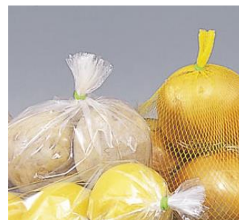
〈エアパックナーと袋・ネット詰めイメージ〉