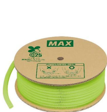
〈バイオマス プラステープル〉

希望小売価格は、ボビン1巻・12,000本入りで16,000円(税込 17,600円)です。