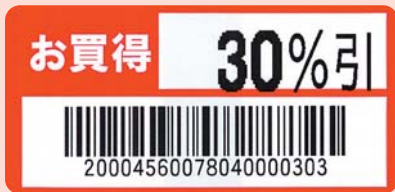
幅52mm×ピッチ25mm (レイアウト例 実寸)