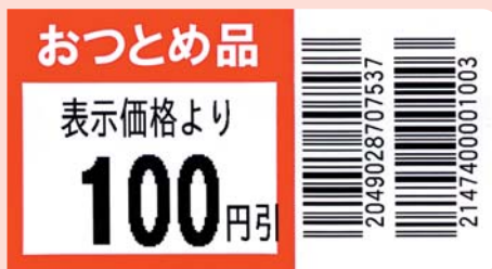
幅32mm×ピッチ60mm (横レイアウト例 実寸)