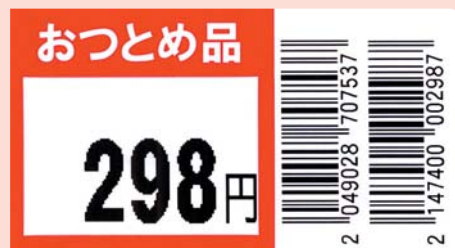
幅32mm×ピッチ60mm (横レイアウト例 実寸)