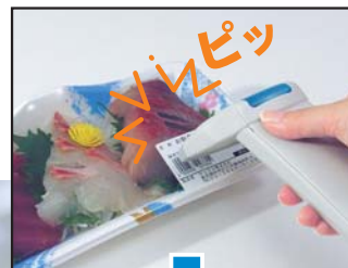
スキャナは別売です。