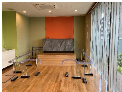
サンルーム(ショールーム)

《本件に関するお問い合わせ先》 マックス株式会社 総務部 IR・広報・ブランド戦略SEC TEL.03-3669-8106 報道に関するお問い合わせは、 こちら まで