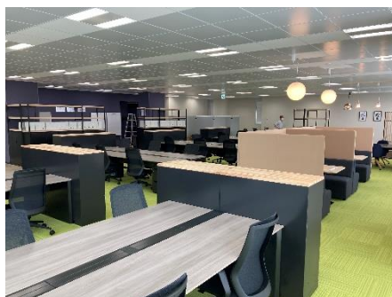
2階 & 3階 オフィス