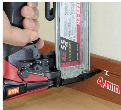
巾木、廻り縁の溝打ち作業