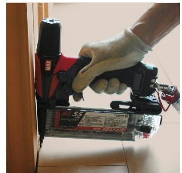
フロア貼り作業の隅打ち