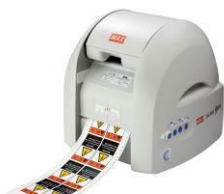
CPM-100SH (フリーカットラベルプリンタ)