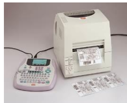
LP-100HRS (スタンドアロントイプ)