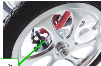
前・後輪ディスクブレーキ