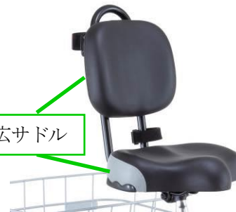
背もたれ付幅広サドル