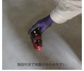
独自形状で地墨が合わせやすい。