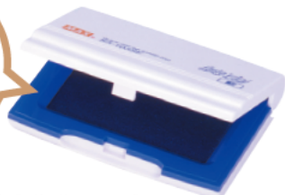
小形1号 ※持ち運びに便利な簡易ロック式