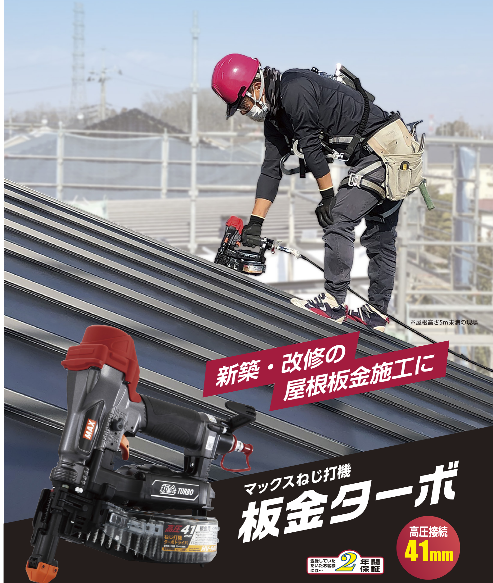
※屋根高さ5m未満の現場