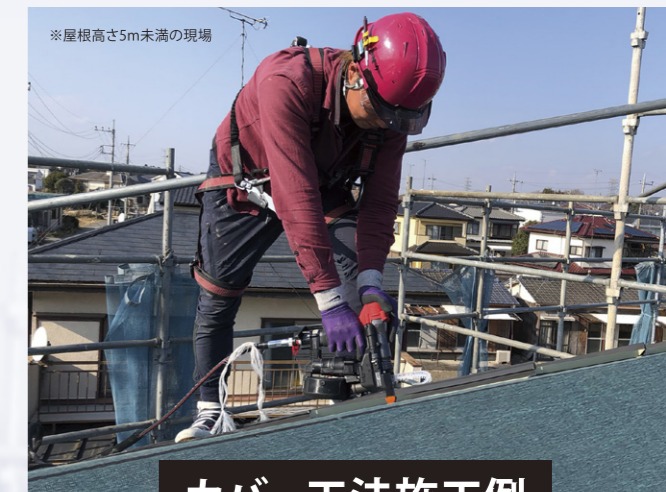
カバー工法施工例