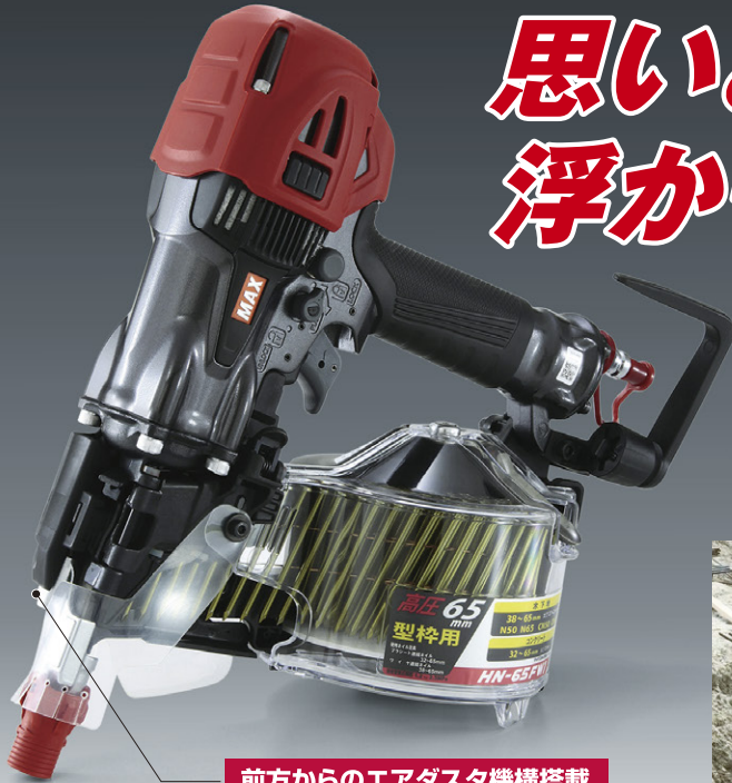
前方からのエアダスタ機構搭載