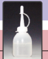
モータ部・ハンマ部 兼用オイル