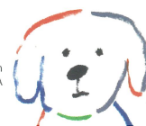
Illustration © Jin KITAMURA